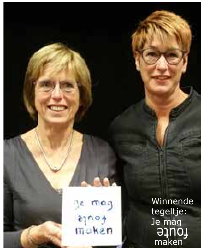
Winnende tegeltje: Je mag agnoj maken